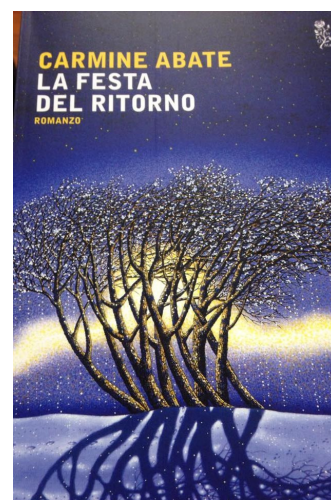
Nella foto l'ultimo romanzo dello scrittore arbëresh, Carmine Abate.

A breve, collegandosi al sito ufficiale del Comune di Santa Sofia si potrà accedere al nuovo portale turistico www.turismo-santasofiadepiro.it creato con lo scopo di diffondere la conoscenza delle peculiarità culturali di Santa Sofia d'Epiro. Tramite vari percorsi virtuali sarà possibile scoprire le bellezze di questa antica comunità fondata dagli Albanesi nel XV secolo, con particolare attenzione al patrimonio artistico e gastronomico pur senza dimenticare gli uomini che l'hanno resa illustre nel tempo. La stesura dei testi esplicativi del nuovo portale, per quanto riguarda la parte culturale, è stata affidata all'Operatore dello Sportello Linguistico dell'Unione Arberia con sede decentrata in S. Sofia d'Epiro.