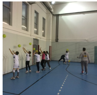
Nella foto il Centro Avviamento dello Sport.