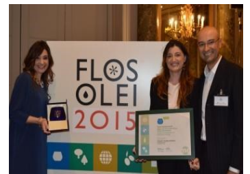
Nella foto il momento della premiazione dell'Olio Librandi.

Historisë së Vëndit në Kalabri, i cili pas të paraqitë artistet e ndryshme dhe një përshkrim të përpiktë mbi gjithë veprat e ekspozuar. Ngjarja pat rëndësi dhe kureshtje aq për qytetarët aq për institucionet shkollore, dhe vizita e drejtuar iu dha studhentëve mundësia të qasëshin afër botës së artit bashkëkohës.