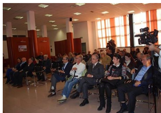
Nella foto alcuni Sindaci presenti all'incontro.